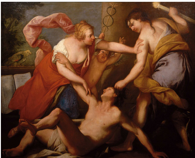
L'eloquenza libera l'innocente dalla calunnia , Gregorio Lazzarini, fine Seicento, olio su tela, collezione privata